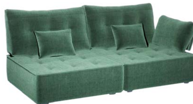
Avec accoudoirs gauche et droite