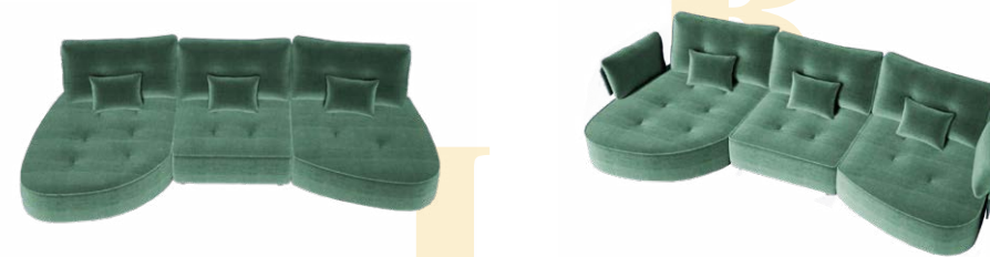
Modules centraux ovales avec modules terminaux (avec et sans accoudoir)